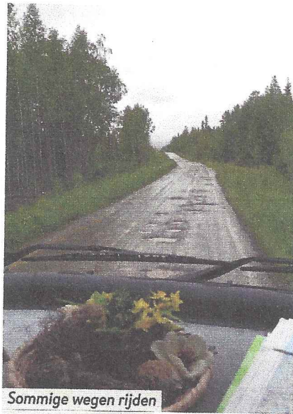
Sommige wegen rijden als over een wasbord.

bij de Sami. Het feest wordt hier niet zo grootschalig gevierd als in Leksand, waar we eerder waren en waar jaarlijks duizenden mensen op afkomen.