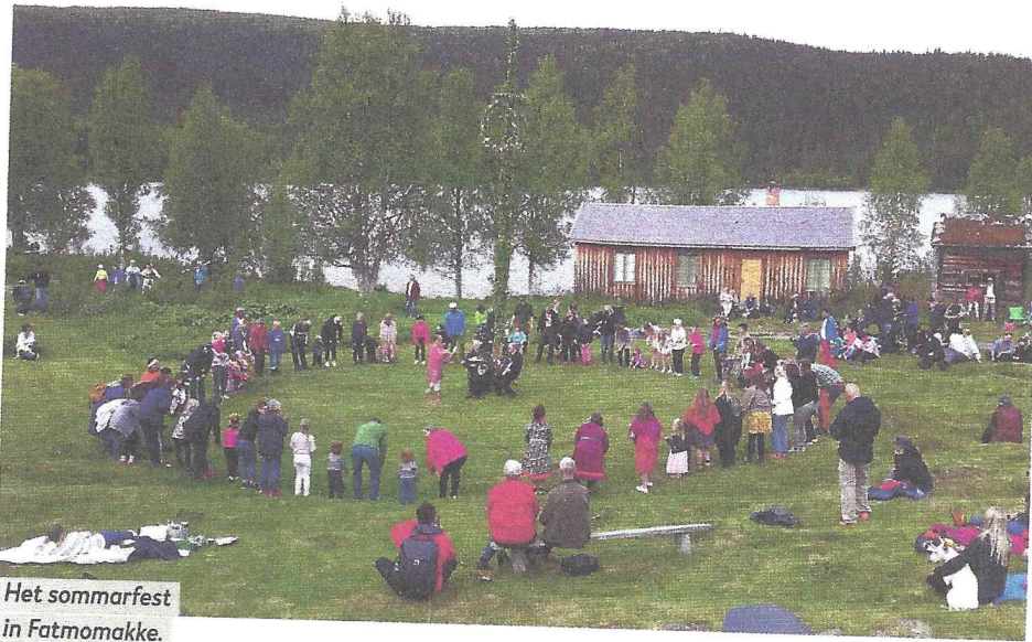
Het sommarfest in Fatmimakke.