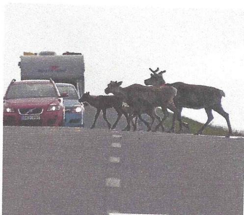
Een familie rendieren maakt z'n naam bij het oversteken niet waar.

Op de vrijdag die het dichtst bij 21 juni ligt, begint jaarlijks het drie dagen durende sommarfest. Het is de dag van de zonnwende: de dag waarop de zon het langst aan de hemel staat en de nacht het kortst is. We maken het feest nu voor de derde keer mee, deze keer