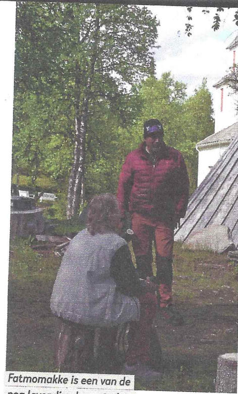
Fatmimakke is een van de nog levendige Lappstaden.

Om de bezienswaardigheden te bereiken, moeten we de hoofdroute regelmatig verlaten en soms slechte, onwerharde wegen volgen